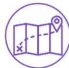
中国文化体验与考察