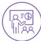
中国文化系列讲座