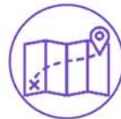
中国文化体验与考察